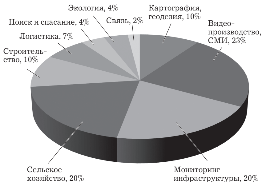
Рис. 2. Доля использования БАС на российском рынке по отраслям

По данным доклада Федерального агентства воздушного транспорта (Росавиация) на 2023 год, ключевыми отраслями использования БВС являются картография, геодезия, строительство и сельское хозяйство. Наибольший спрос на БАС, по мнению специалистов Росавиации, наблюдается в сфере СМИ, развлечений и подобной отрасли видеопроизводства 1 .