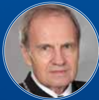
Зорькин Валерий Дмитриевич Председатель Конституционного Суда РФ