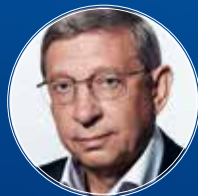
Евтушенков Владимир Петрович Основатель АФК «Система»