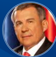
Минниханов Рустам Нургалиевич Президент Республики Татарстан