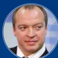
Скоц Андрей Владимирович Депутат Государственной Думы Федерального Собрания РФ