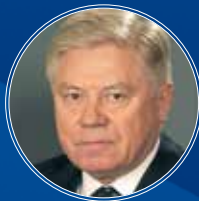
Лебедев Вячеслав Михайлович Председатель Верховного Суда РФ