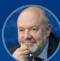
Крашенинников Павел Владимирович Председатель Комитета Государственной Думы Федерального Собрания РФ по государственному строительству и законодательству