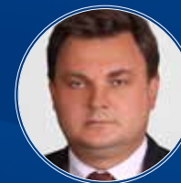
Чуйченко Константин Анатольевич Министр юстиции РФ