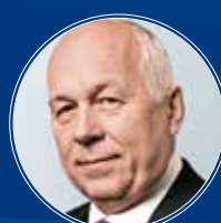
Чемезов Сергей Викторович Генеральный директор Госкорпорации «Ростех»