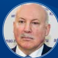
Мезенцев Дмитрий Федорович Государственный секретарь Союзного государства