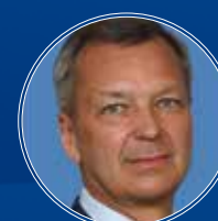
Яцкин Андрей Владимирович Первый заместитель Председателя Совета Федерации Федерального Собрания РФ