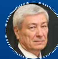
Чиханчин Юрий Анатольевич Директор Федеральной службы по финансовому мониторингу