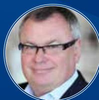
Костин Андрей Леонидович Президент-председатель правления ВТБ